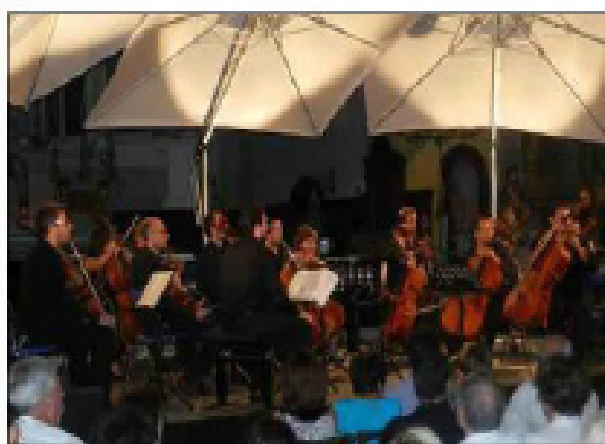
Les musiciens du festival Cello Fan pendant le concert de samedi dans l'église de Callian.

Un peu plus de 2500 personnes ont assisté aux concerts durant cinq jours. Ce cru 2015 aura marqué le public en raison de son offre généreuse et de grande qua-